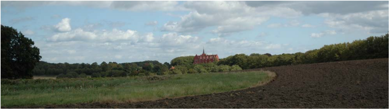
Tranekær Slot set fra sydvest.