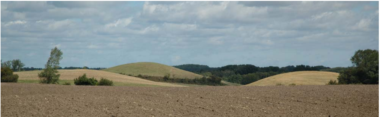
Hatbakker med Hestehave Skov i baggrunden, set fra syd.