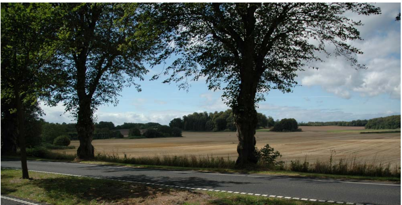
Udsigt fra alléen nord for Tranekær Landsby.