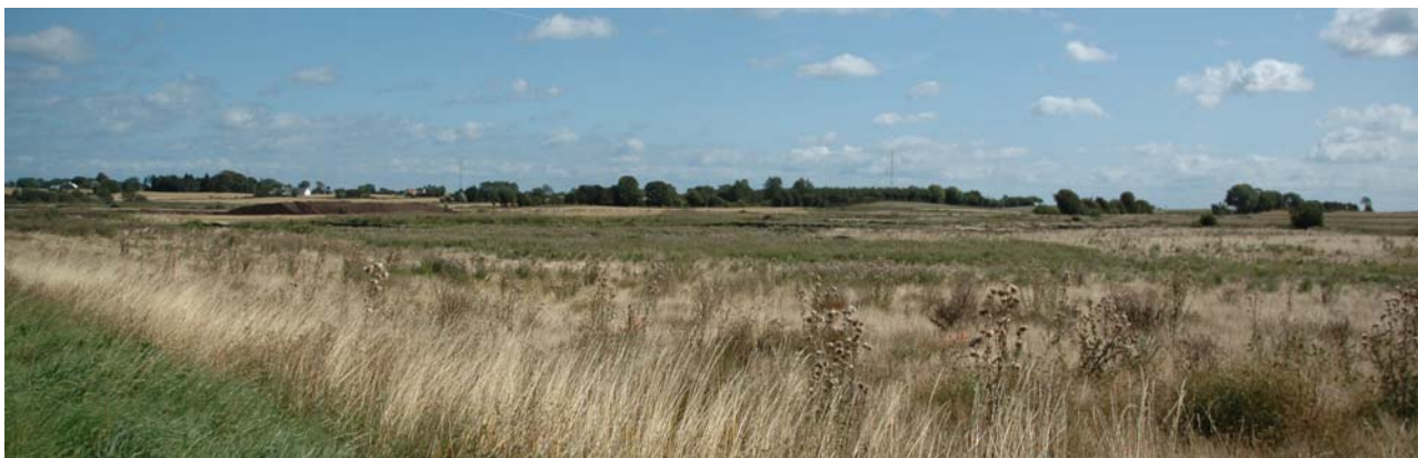
Skovmose øst for Botofte. Set mod nord.

De store skovpartier med åbne dyrkede områder imellem sig giver et enkelt landskab med mellemstore til store lukkede landskabsrum. Især omkring Tranekær skaber det smukke kig mod slottet og over de flade moseområder. Langs kysterne er landskabet åbent med udsyn over vandet mod den modstående kyst på Fyn mod vest og Sjælland og Lollands modstående kyster langt ude i horisonten mod øst.