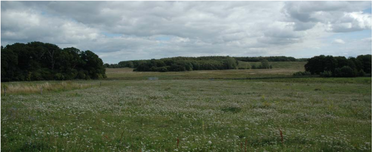
Engområdet, Flådet, syd for Tranekær.