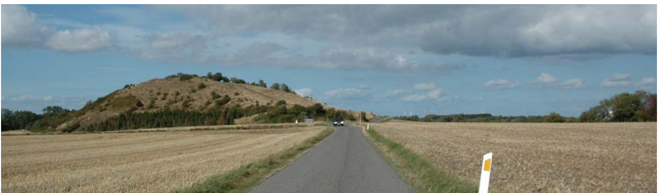
Fakkenbjerg, hatbakke i det forholdsvis flade landskab på den sydlige spids.