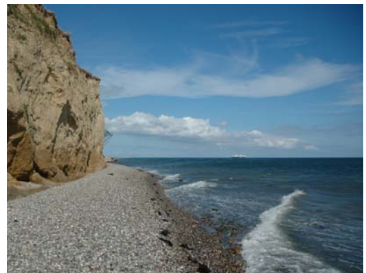
Stenstrand ved Dovns Klint.