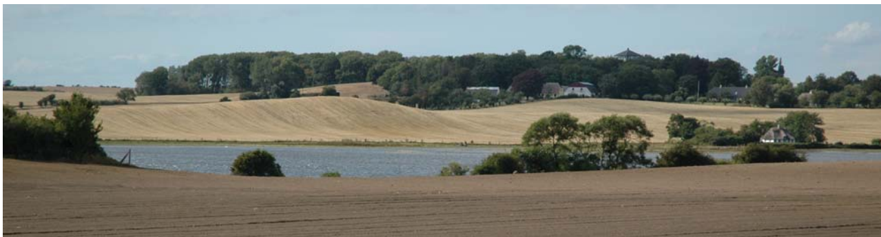
Nørreballe Nor, der er blevet genoprettet som sø, set fra øst.

Landskabet på sydspidsen af Langeland karakteriseres i særlig høj grad af hatbakker, der rejser sig med fra et forholdsvis fladt ekstensivt dyrket morænelandskab og en mosaik af mindre skovområder, flere placeret helt ud til kysten, hvor de sætter de to markante klinte Dovns Klint og Gulstav Klint i perspektiv. Alle skovene har formentlig været drevet som stævnings-skove gennem århundreder. Den regelmæssige stævnings skabte særlige betingelser for en rig urteflora, og stævnings-skove kaldes også for skovhaver eller stubhaver. Stævningsdriften var et led i landsbyernes selvforsyning med råprodukter. I de stats-ejede områder ved Gulstav opretholdes stævnings-skovene af kulturhistoriske grunde, mens brugsformen for længst er funktionstømt og forladt. I området findes desuden vilde heste.