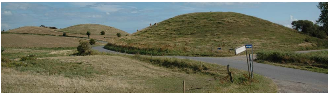
Tæt koncentration af hatbakker omkring Stat-Hartstræde ved Nordenbro.