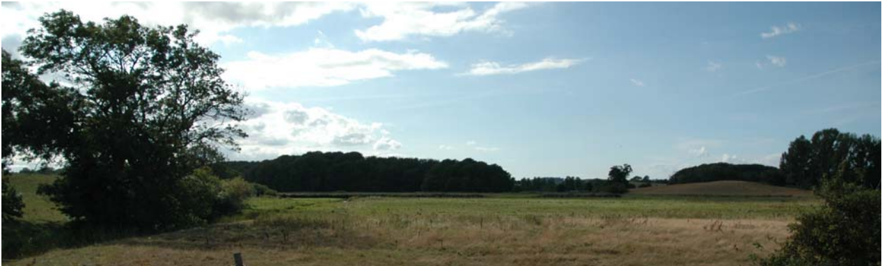
Engområde syd for Skovsgård.