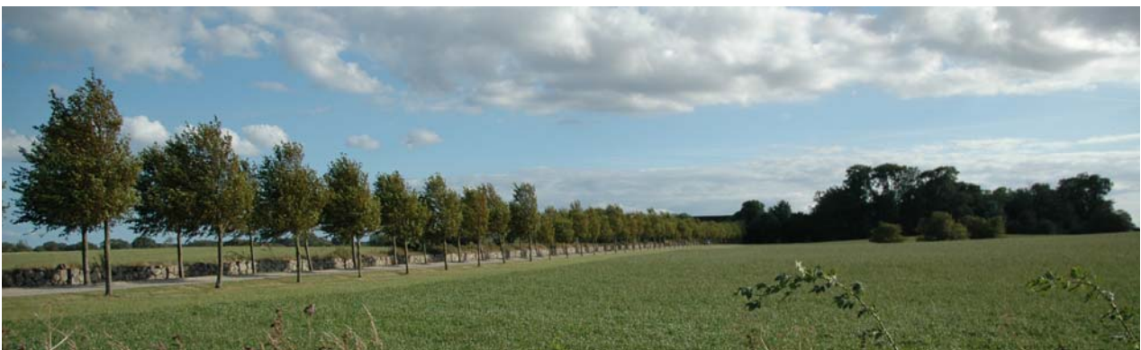
En af de to alléer der fører ind til Skovsgård.