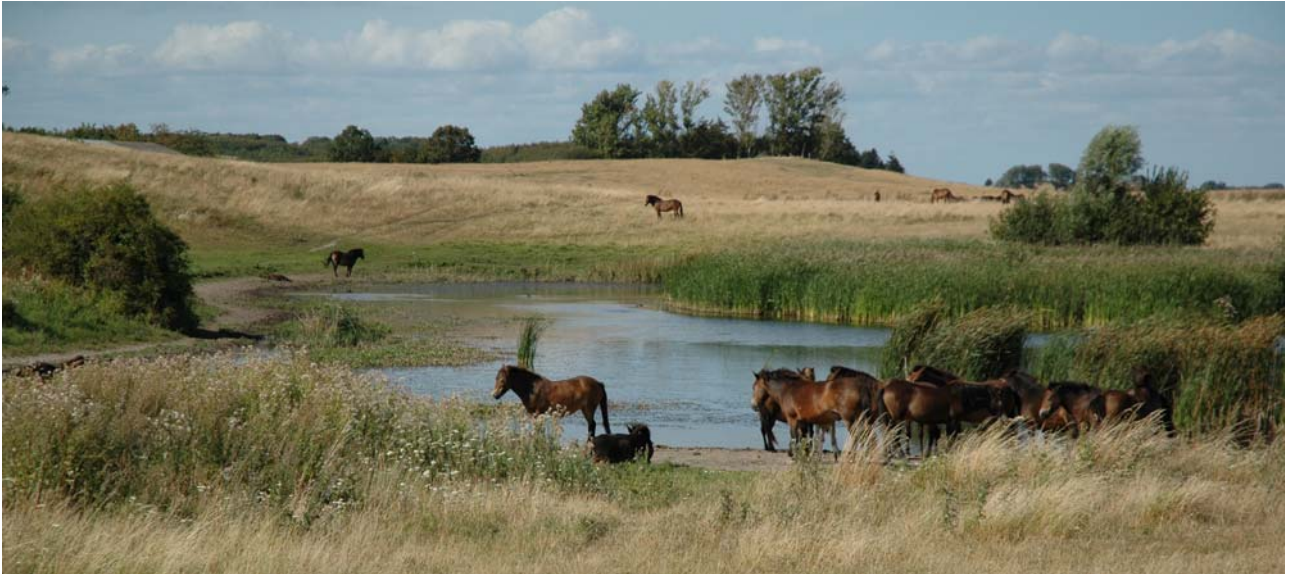
Vilde heste ved Gulstav.