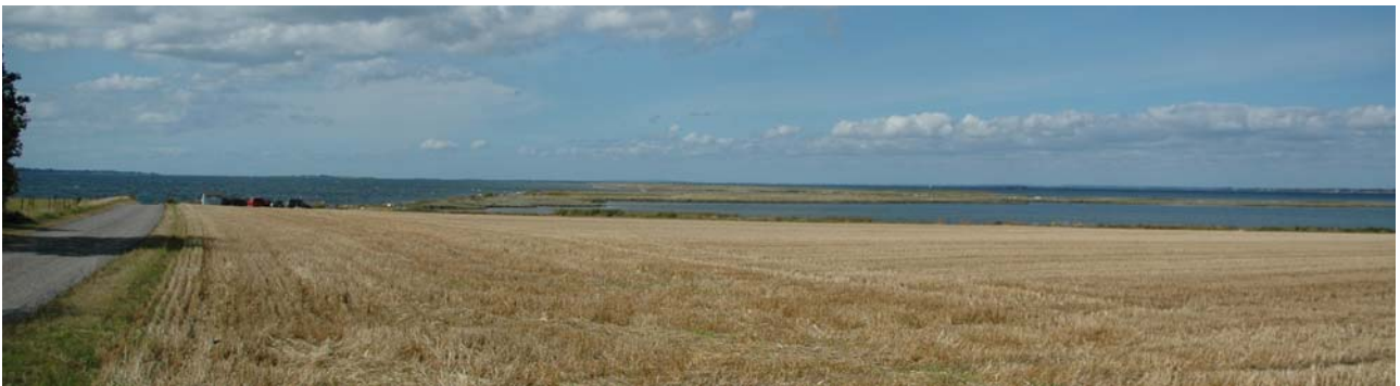
Ristinge Hale.