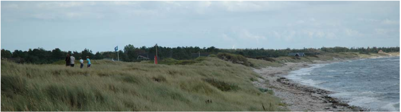
Ristinge Strand. Set mod sydøst.