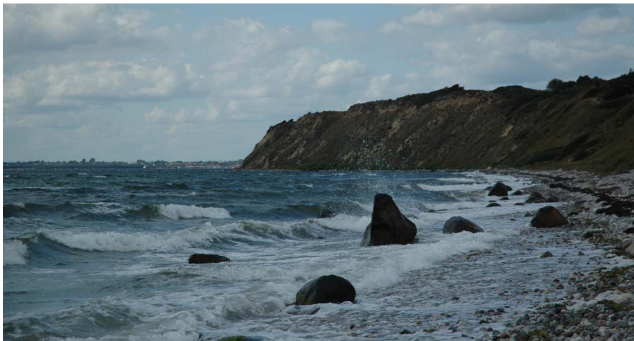
Ristinge Klint. Foto set mod vest med Ærø i baggrunden.

De små markfelter og bebyggelsens størrelse skaber tilsammen et småskala, men åbent landskab med gode udsigter over havet. Landskabet fremstår enkelt, kun med få landskabselementer, som primært består af bevoksningen dels på digerne dels langs vejene og bebyggelsen, som er samlet langs vejene.