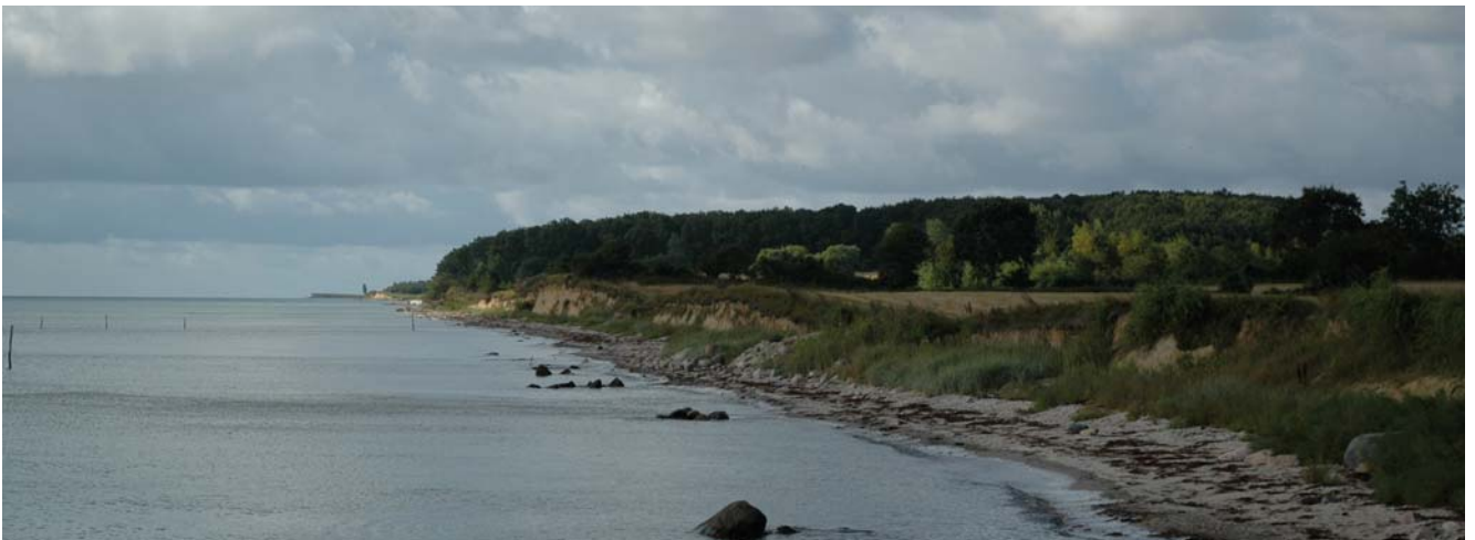
Klintkyst med smal strandbred og kystnært skovområde i baggrunden. Set fra Østerhuse mod syd.