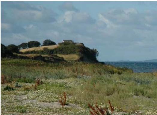
Franke Klint set fra nordvestlige spids.