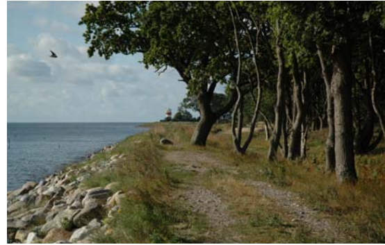
Udsigt mod Hov Fyr set fra nordøstlige spids.