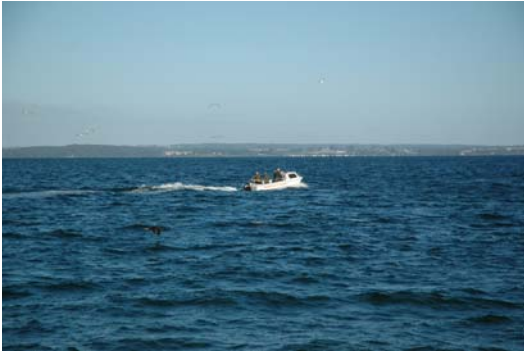
Udsigt fra Lohals mod Fyns kyst