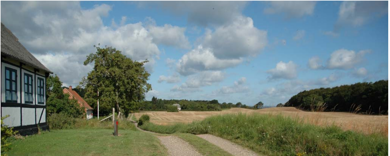
Landskabsrum mellem skovområderne Vester Stigehave og Vester Prisskov.

Bebyggelsen i området findes i klynger langs vejene, mange gange med skovbrynene i ryggen eller som spredt beliggende gårde og huse. Den største by er landsbyen Lohals på vestkysten, der indtil 1998 fungerede som færgehavn med forbindelse til Korsør. På hver side af nordspidsen står fyr, Franke Fyr mod vest og Hov Fyr mod øst.